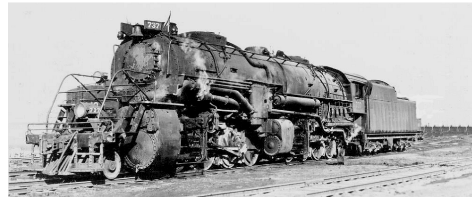
- locomotora 153 - 2882 Virginian -